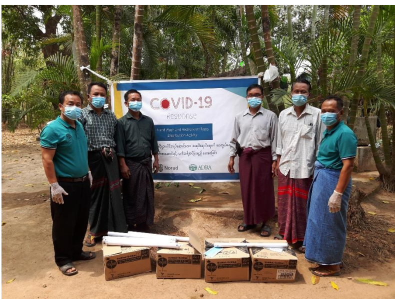
Bilde fra koronaforebyggende kampanje i Myanmar.

Myanmar – Enkelt forklart på engelsk: What is happening and why , BBC: https://www.bbc.com/news/world-asia-55902070